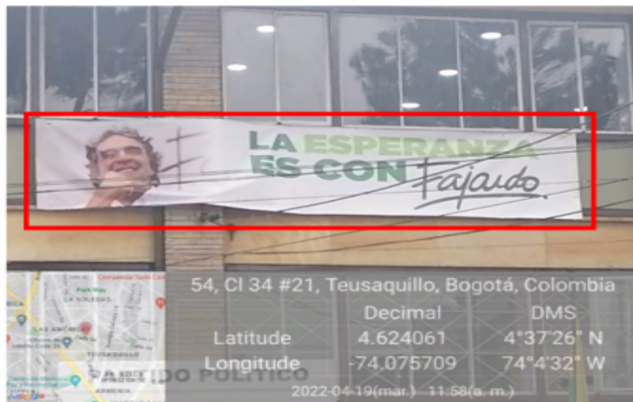
Fotografía No. 3

En la cual se evidencia el texto publicitario: LA ESPERANZA ES CON FAJARDO+ FOTO DEL CANDIDATO